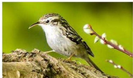
Grimpereau des jardins