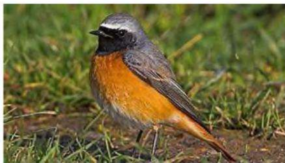
Rouge-queue à front blanc