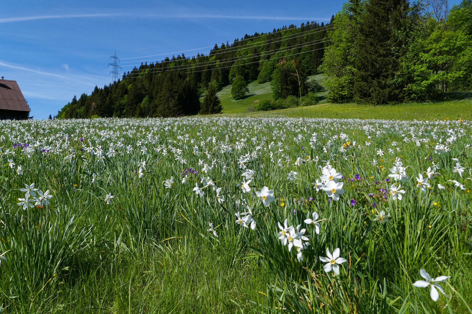
Une prairie remplie de neige de mai.

Remonter d'une pente constante à travers des sublimes champs de narcisses jusqu'à rejoindre une route carrossable sur la crête. Continuer ensuite l'ascension sur la route. Les champs de narcisses sont plus petits, mais pas moins beaux.