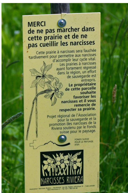
Respectez et protégez les narcisses !

Les promeneurs peuvent aussi protéger les narcisses. Des panneaux installés le long du parcours leur demandent de rester sur les chemins, de ne pas marcher dans les prairies pour éviter de piétiner les fleurs et de