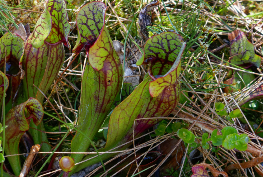
Les plantes carnivores.

Depuis le parking des Motalles partir plein N sur une route carrossable en direction des Tenasses (si jamais les panneaux du tourisme pédestre sont à proximité du pont à l'entrée du hameau de Lally ...). Une vingtaine de mètres plus loin continuer sur le branchement de gauche (suivre le balisage jaune). Rapidement on passe d'une route carrossable à une passerelle en bois. Elle est indispensable pour progresser sans s'enfoncer dans le sol humide du marais des Tenasses . On passe à côté d'un large panneau didactique qui décrit l'histoire du marais.