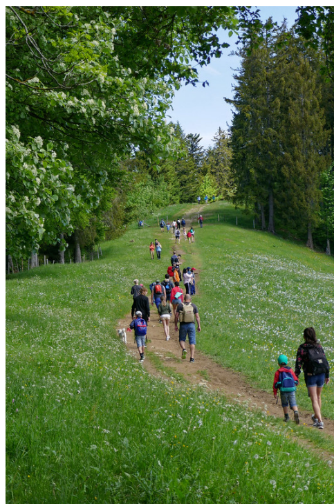
Les parcours est par moments bien fréquenté...

Rejointe la route de Lally , continuer de nouveau à gauche jusqu'à rejoindre le parking de Tenasses quelques 250 mètres plus loin.