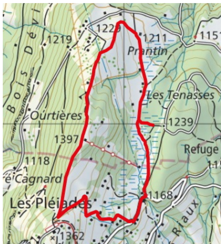
Carte nationale.

Prendre le train crémaillère au départ de la gare de Vevey jusqu'aux Pléiades (terminus). La balade commence alors par la descente qui gagne la Route de Lally .