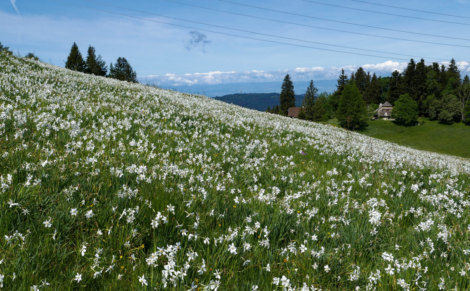
Une autre prairie où les narcisses abondent.